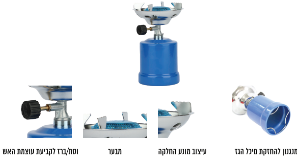
סח/ברד לקביעת עוצמת האש